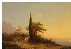
Paysage en Crimée Ivan Aivazovski